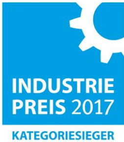
Bild 1: Auf der Hannover Messe wurde Multec mit dem INDUSTRIEPREIS 2017 in der Kategorie „Produktionstechnik & Maschinenbau“ für den